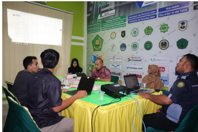
Rapat Tim PPID

Selain memberikan layanan informasi kepada publik, PPID IAIN Langsa melakukan rapat dan pembinaan kepada petugas PPID sebanyak 3 kali di tahun 2021. Hal ini dilakukan untuk meningkatkan kapasitas petugas agar dapat memberikan layanan yang optimal dan menghadapi pemohon dengan berbagai karakter. Agenda 3 kali tersebut meliputi rapat melalui zoom dan offline.